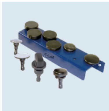
GL 2 KIT 2 Kann an bestehendes KIT 1 montiert werden. Can be easily mounted on the existing KIT 1.