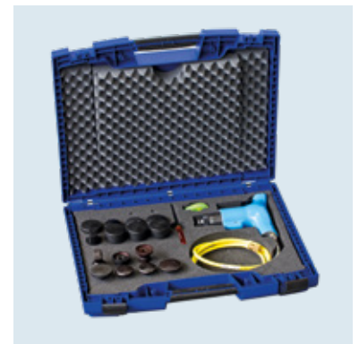
GL 2 MAX KIT 3 Alles in einem Koffer. Everything in one box.